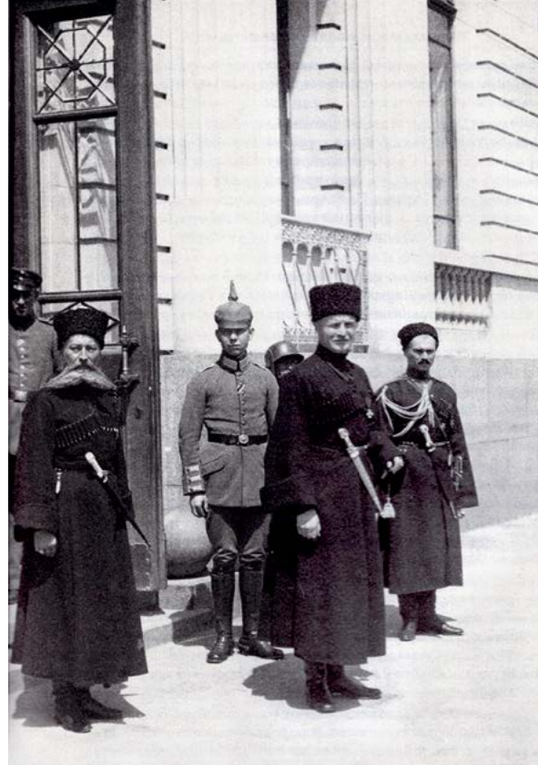
Hetmanis Pavlo Skoropadskis (centrā) ar ukraiņu un vācu virsniekiem. Kijeva, 1919. gada maijs (Я. Тинченко. Війська Ясновельможного пана Гетьмана).

1918. gada novembrī arī Vācijā un Austroungārijā notika revolūcija, un tās mainīja politisko situāciju Ukrainas Valstī. 14. novembrī hetmanis Pavlo Skoropadskis izdeva universāli par Ukrainas