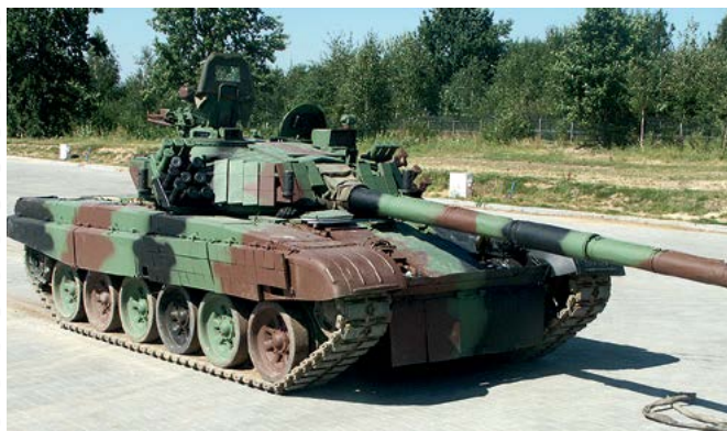
Polijas BS tanks PT-91 .

Vienu no tanku PT-91 potenciālajiem modernizācijas variantiem jau ir piedāvājusi kompānija «Bumar-Łabędy», kas ietilpst apvienībā «Polska Grupa Zbrojeniowa» (PGZ). «Bumar-Łabędy» piedāvā aprīkot PT-91 ar jaunās paaudzes aktīvo bruņu aizsardzību, nomainīt stobrus ar Slovākijā ražotajiem 2A46MS , kam ir modernizēta lādēšanas un uguns