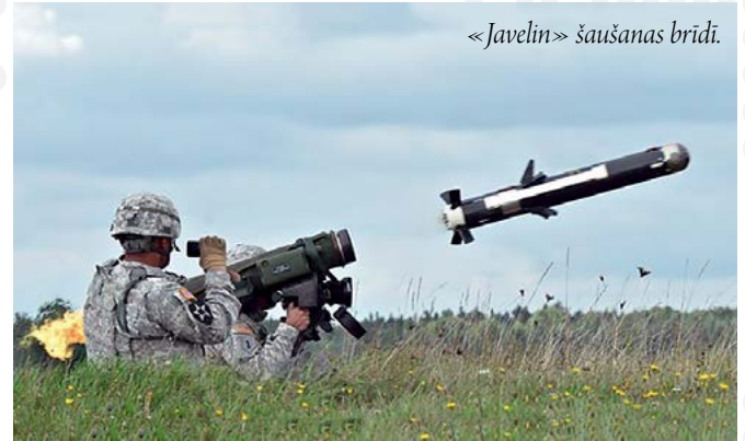
«Javelin» šaušanas brīdi.

Decembra vidū Igaunijas Aizsardzības spēki saņēma pirmās modifētās pārnēsājamo raķešu kompleksu raķetes «Javelin Block 1». Šiem kompleksiem paredzēto munīciju (raķetes) piegādāja kopuzņēmums «Javelin», kas ražo arī pašus kompleksus. Kopuzņēmumu veido divas korporācijas: «Raytheon» un «Lockheed Martin».