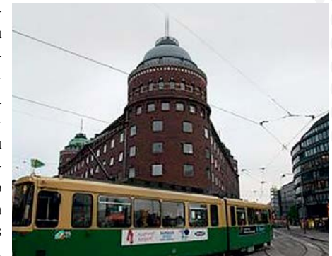
Izlūkošanas dienesta ēka Tikkaoski.