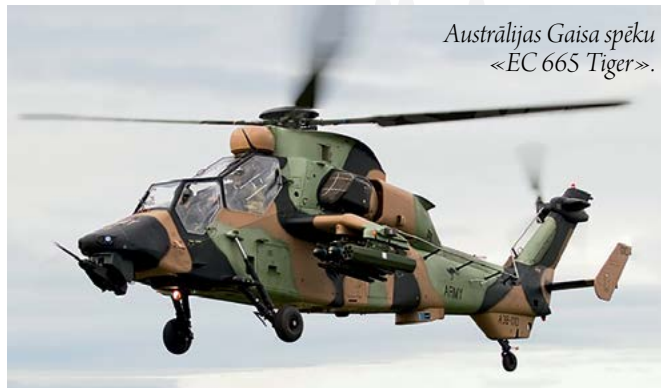
Austrālijas Gaisa spēku « EC 665 Tiger ».

« EC 665 Tiger » ir mūsdienīgs triecienuhelikopters, ko jau no 1991. gada ražo Francijas un Vācijas konsorcijs « Eurocopter ». Pirmie šādi helikopteri Francijas Gaisa spēku ierindā tika iekļauti 2003. gadā. Līdz mūsdienām ir saražoti 200 « EC 665 Tiger » markas helikopteri dažādās modifikācijās, un tie iekļauti gaisa spēku sastāvā ne tikai Francijā un Vācijā, bet arī Spānijā un Austrālijā.