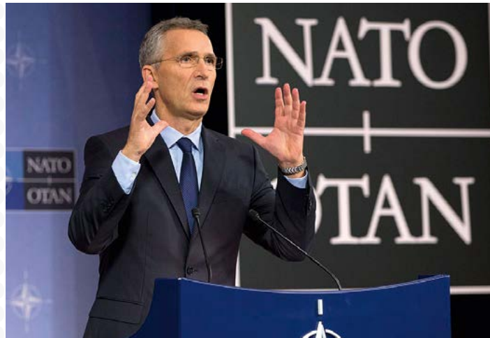
J. Stoltenbergs 2017. gada 7. novembrī NATO galvenajā mitnē Briselē.

J. Stoltenbergs arī uzsveris, ka NATO limeni tiks uzsākti pasākumi, kuru mērķis būs uzlabot un atbilstoši NATO standartiem modernizēt alianses dalībvalstīs esošos galvenos ceļu tīklus, tiltus, ostas un dzelzceļu infrastruktūru, ko varēs izmantot militāro vienību ātram tranzitam.