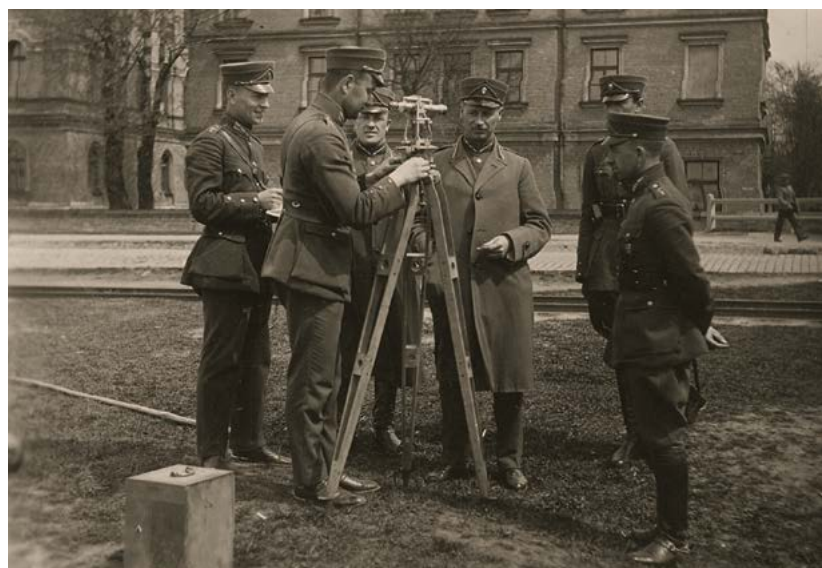
Artilērijas virsnieku kursos Rīgā. 1926.–1927. gads. Centrā — kursu priekšnieks pulkvedis A. Dannebergs.