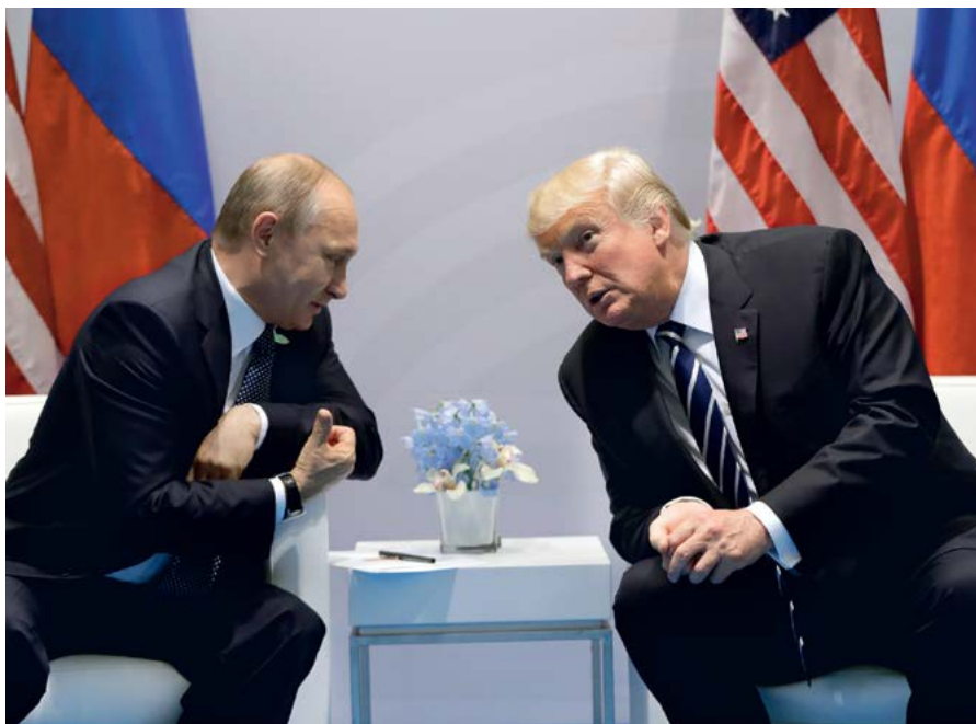
V. Putina un D. Trampa pirmā tikšanās norisinājās 2017. gada 7. jūlijā Hamburgā, G-20 valstu samitā.

Komentējot Amerikas Savienoto Valstu Nacionālās drošības stratēģiju, Krievijas pārstāvji to nosaukuši par imperiālistisku, vienpolāru un agresīvu, solot reaģēt uz to ar «atbilstošiem soļiem». Uzrunājot Krievijas Bruņoto spēku vadību, Vladimirs Putins uzsvēris, ka neļaus ieraut Krieviju jaunā bruņošanās sacensībā, bet gan meklēs inovatīvus risinājumus, atbildot ASV. Maskava veidošot jaunās paaudzes armiju 1 , izstrādāšot ultramodernas