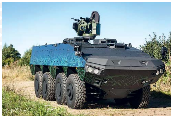
« Patria AMV XP ».

Bruņutransportieris « Patria AMV XP » pirmo reizi tika prezentēts Londonā 2013. gadā starptautiskajā izstādē DSE (International Defence & Security Exhibition) . Toreiz šim BTR bija dots nosaukums « Enhanced AMV ». Pilnveidota « Patria AMV » versija XP (Extra Payload, Extra Performance and Extra Protection) tika izstrādāta 2001. gadā. Atšķirībā no priekšgājēja XP ir uzlabota bruņu aizsardzība (arī pretmīnu aizsardzība), pilnveidots dīzeldzinējs, palielināts salons un ir lielāki riteņi. Pilnā « Patria AMV XP » masa ir 32 t, bet efektīvā krāvnēsība — 15 t.