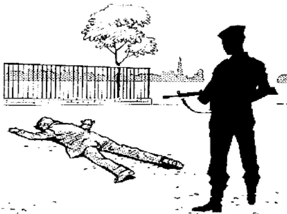
5. zīmējums. Pozīcija „Aizturētais stāvoklī guļus”