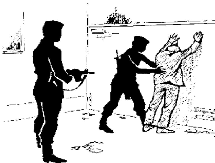
6. zīmējums. Pozīcija „Aizturētās personas pārmeklēšana”