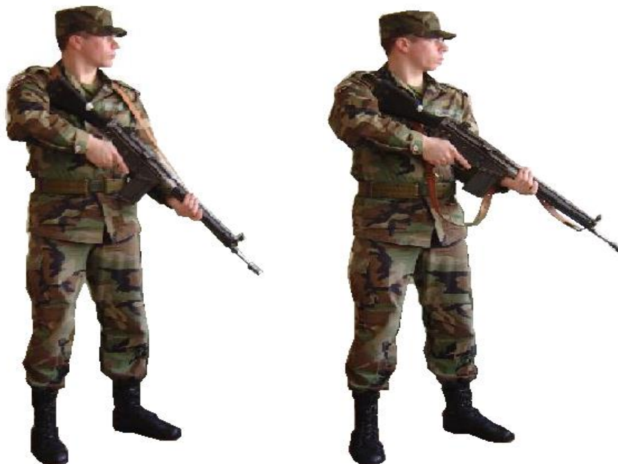
2. zīmējums. Pozīcija „Patrulēšana”