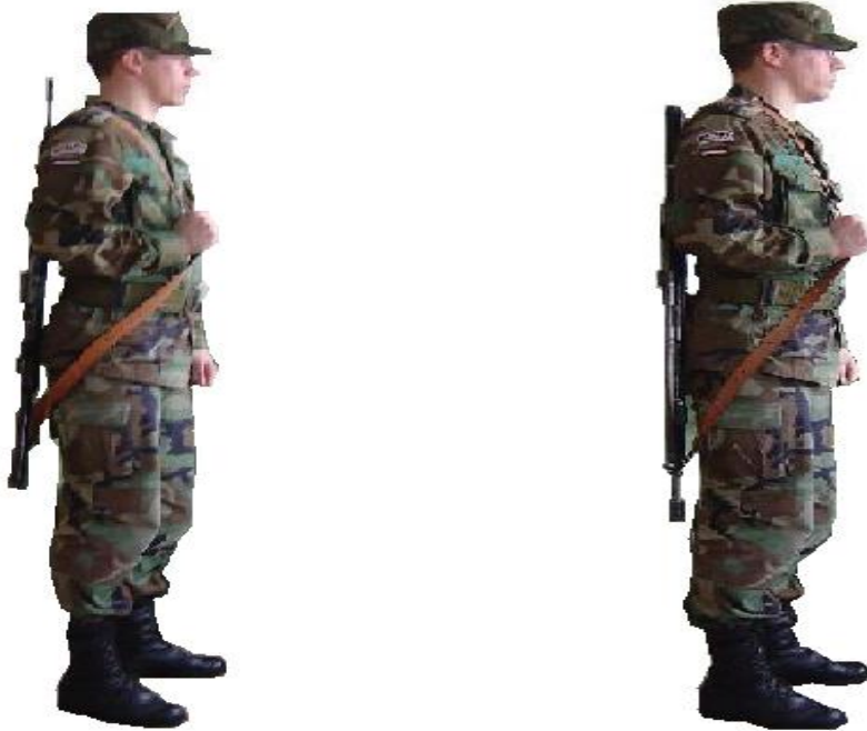
1. zīmējums. Pozīcija „Ierocis siksniņā”